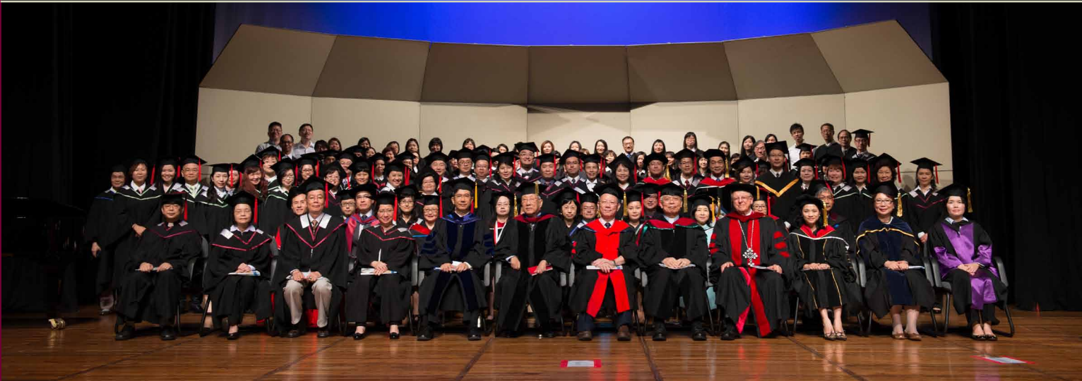
主禮人與眾畢業生合照