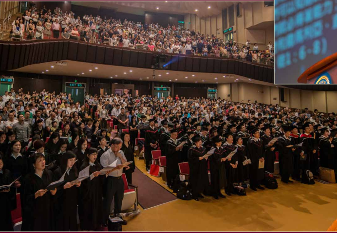
會眾一同歌唱讚美