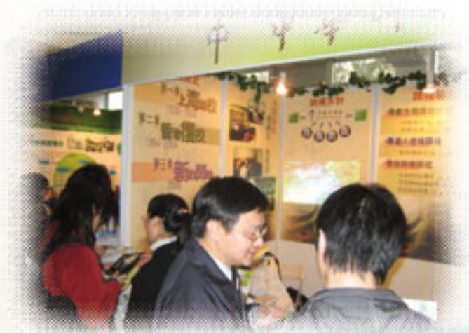
同學們在展覽攤位解答來賓之詢問。