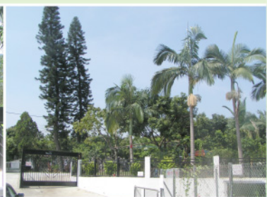
學院未來新院址正門