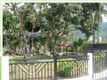
學院未來新院址外圍