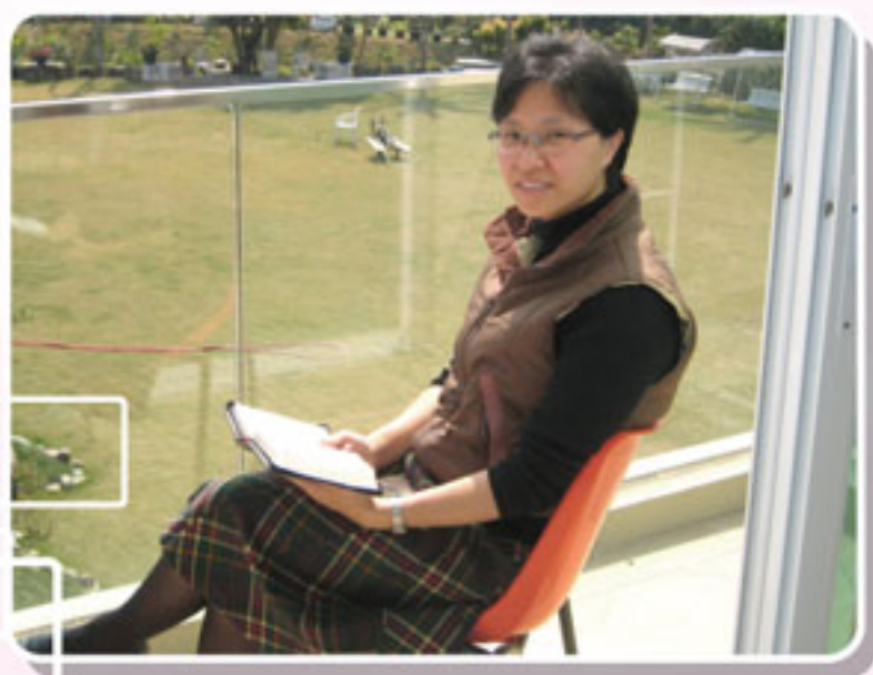
作者攝於圖書館露台

在不同環境中的學習各有不同；以前處身於繁囂之地，學習節制的功課，現今在青山綠樹中的環境學習簡樸的生活。這兩種不同的學習對於我來說，是一個很好的體會。就如保羅說「無論在甚麼景況都可以知足……知道怎樣處卑賤，也知道怎樣處豐富，或飽足，或飢餓，或有餘，或缺乏，隨事隨在，我都得了秘訣。我靠著那加給我力量的，凡事都能做。」（腓四 11-13）