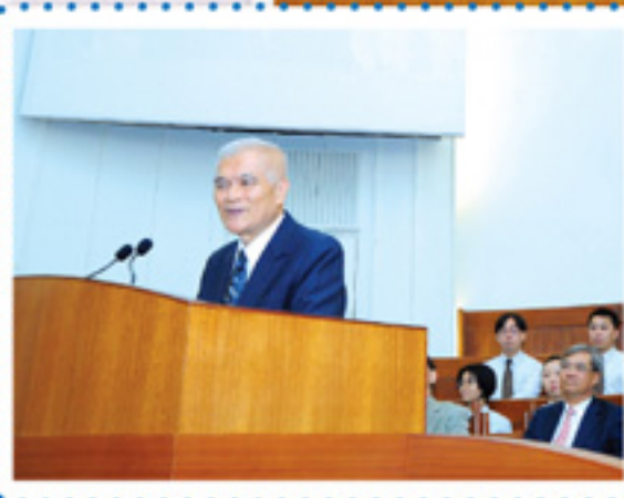
龍維耐醫生致賀辭