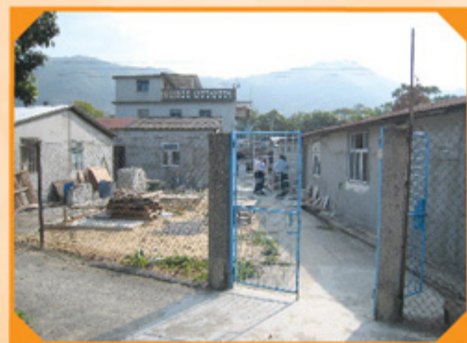
男、女生新宿舍的外貌

自從舊臨時宿舍於六月份拆卸後，父神為學生們在新院址附近預備了數幢房子，可以租作學生宿舍之用。經過兩個多月的裝修，已於十一月尾完工。十二月學生放假期間，師生同工合力將六月份儲存於倉房的傢俱取出，運到新租用的男、女生宿舍去。2013 年 1 月冬季學期學生又可再次享受正常的宿舍的生活。感謝信實的主奇妙的預備。