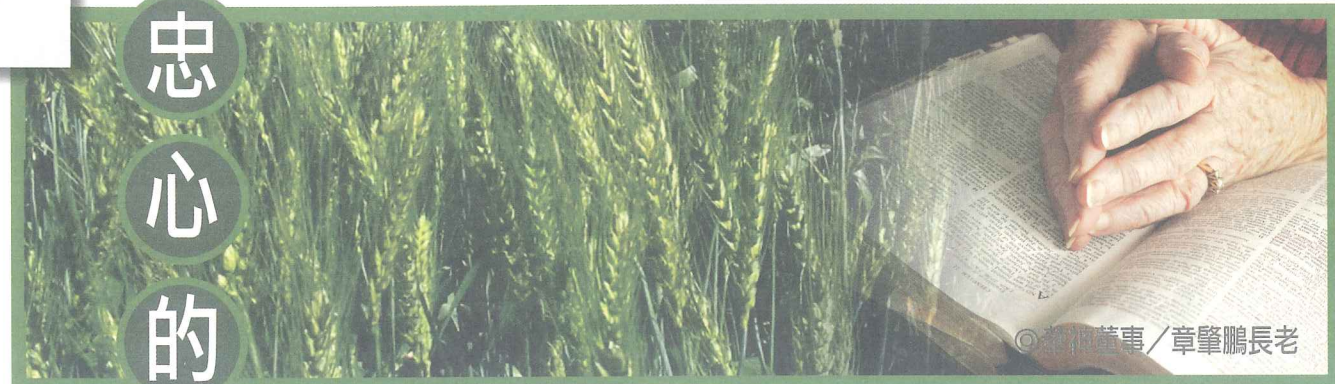
◎ 敬禮董事 / 章肇鵬長老

感謝神豐富的救恩，使我們如今得以站在祂的恩典中靠主而活，並經歷祂所賜豐盛的生命。這些年看見神在台灣作大事，透過教會的合一，讓基督徒更有力的向社會傳達美好的見證，我們也看見主將得救的人天天加給教會，台灣基督徒的比例由不到3%提昇到接近5%，我們深信神還要繼續在這塊土地上成就大事，惟願我們回應祂的恩典，在祂的帶領下，攻破堅固的營壘，使復興的火遍燃寶島。