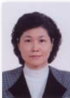
白苓 / 浸信會懷恩堂

感謝華神提供給這麼好的課程，感謝老師們全心全意全人、以身以言的教導和引領，也感謝同學們相互為伴、扶持成長。