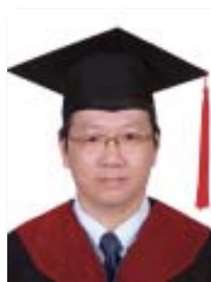
萬喜良 馬來西亞基督教巴色會山打根堂

更廣認識上帝的豐富，更近看見自己的不足，更深體會主愛的看顧，更遠與神同行奔天路。