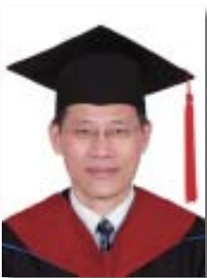
江榮 東海大學基督教會