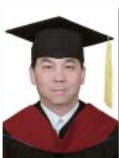
王乃純 基督教論壇報

在神的手中真是穩妥，回首過去，更使我不得不讚嘆神的計劃奇妙，期許在未來的事奉道路上，更加懂得等候與跟隨。