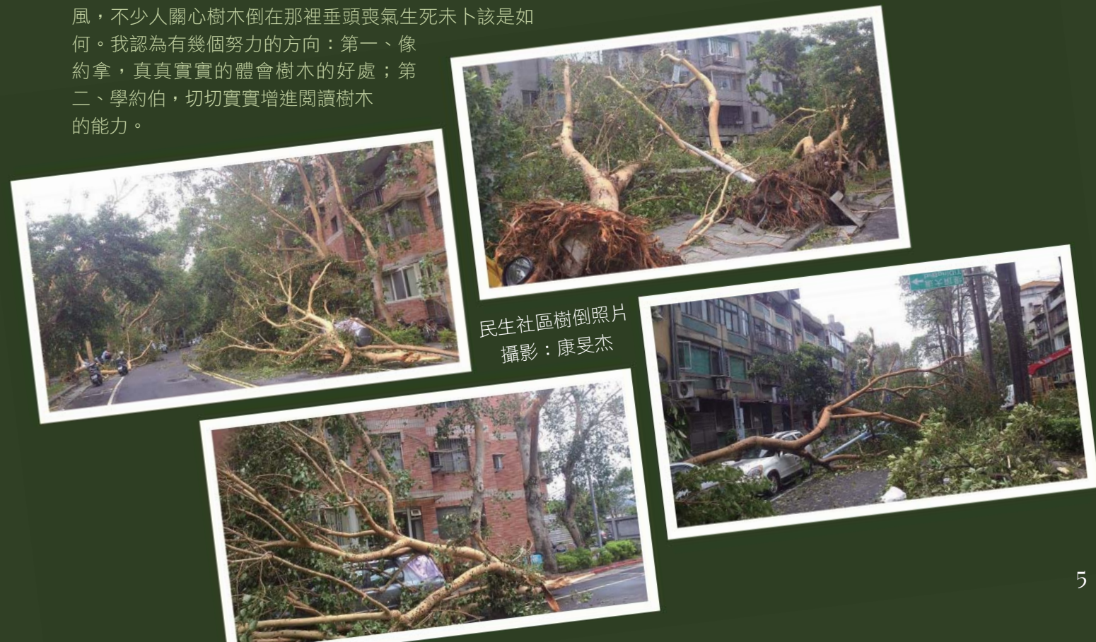
民生社區樹倒照片

1. calculated using World Bank population estimates and urban ratios from the United Nations World Urbanization Prospects. 依據聯合國都市化預測與世界銀行人口估計。