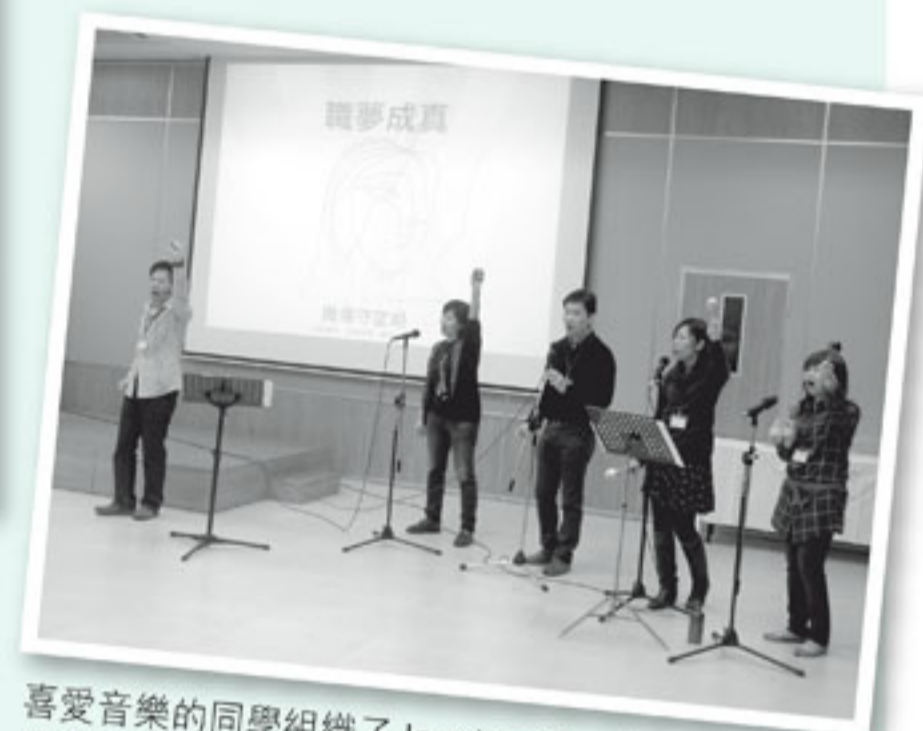
喜愛音樂的同學組織了JamJam組，在日營內帶領詩歌敬拜。