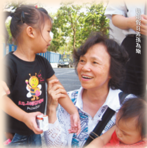
銀姐假日弄孫為樂