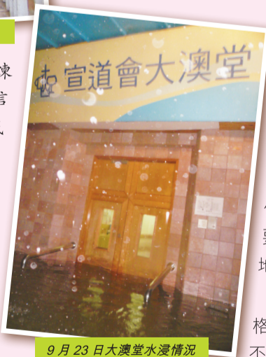
9月23日大澳堂水浸情況