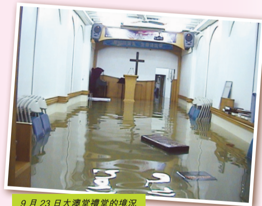
9月23日大澳堂禮堂的情況

用於這次受水浸影響的本區居民。這次事情，受水浸影響的居民不限於年長的，而近岸地下樓層的居民皆受水患影響，甚至一些居於棚屋的居民亦受到波及（棚屋的設計是甚少會因水漲而讓海水湧流入屋的）。我訪問一些八十歲以上的長者，他們都說在他們有生之年未曾遇過這樣的水浸，同時，有些居民回想