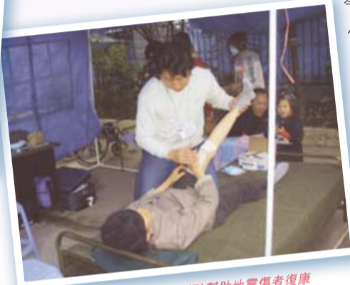
醫療隊員(物理治療師)幫助地震傷者復康

北川縣：整個縣城遭受地震嚴重毀壞，「512」之後一直被封閉，我們從山邊遠眺，看到夏季的雨水帶著沙泥，把她的面貌沖激成另一個更悲慘的樣子。接著前往北川中學的遺址，悼念在該處喪生的千多名學生，期間發現有好多人在不同的角落售買地震的相片和紀念品，彷彿把