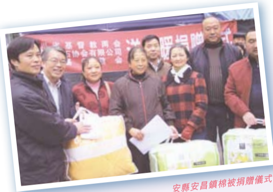
安縣安昌鎮棉被捐贈儀式

近日金融海嘯、經濟衰退、公司裁員等新聞不絕於耳，社會大眾對於四川地震災民和災後重建工作的迫切需要，似乎已漸漸淡忘，然而房角石堅守服侍的使命，響應「一杯涼水，一點愛心，持續關懷」行動，在重災區綿竹市之遵道鎮及綿陽市之安縣，按照當地教會所見的需要和安排，在夏天派送涼水等物資，到了冬天就改派棉被送溫暖。