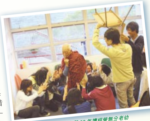
肢體熱烈參與 08 年讀經營無分老幼