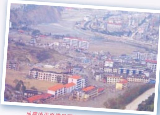
地震後再度遭受雨水沙泥破壞的北川縣城