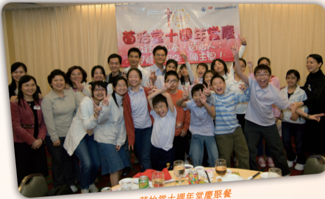
茵怡堂十週年堂慶聚餐

日學；因此，吸引了許多家長及小朋友信主，並參加茵怡堂的聚會。其次，在小朋友入學時，教會亦開設「幼兒家長班」，教導家長如何幫助小朋友適應入讀幼稚園的生活，報