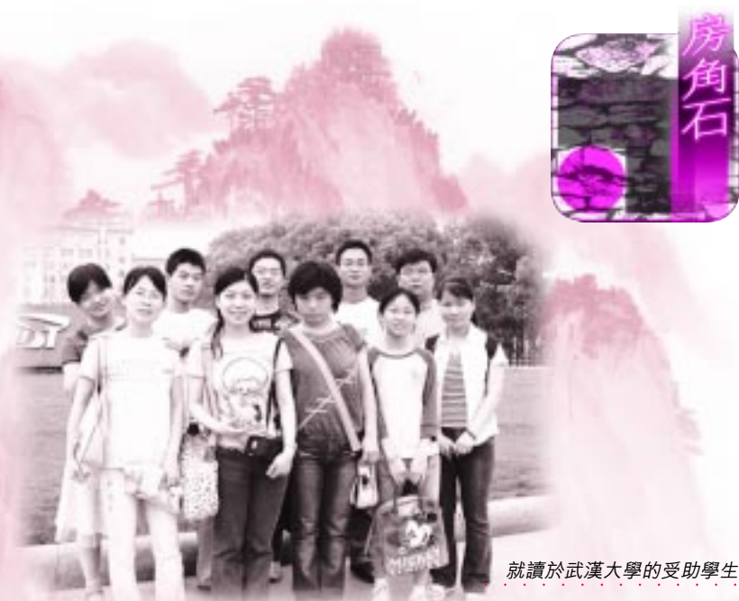
就讀於武漢大學的受助學生

房角石不單為特困生提供學費資助，也透過我們的成員與學生保持書信往來，關心他們的學習生活。所以我們要求受獎助的學生最少每兩個月透過書信，與房角石成員分享他的情況，並在學期末向我們提供成績單副本，讓我們了解他的學業進展。