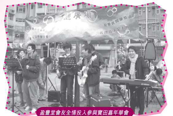
盈豐堂會友全情投入參與寶田嘉年華會