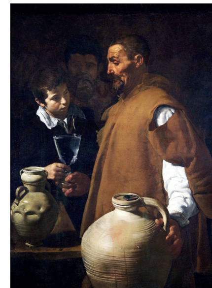
The Waterseller of Seville Diego Velázquez (1618-1622) Apsley House, London

「塞維利亞賣水人」的造型，既是對牧養工作的價值作出肯定和正面評價，同時也是畫家對牧者質素的期望。閱讀這畫，思緒不期然被引到啟示錄二十二章17節：「聖靈和新婦都說：來！聽見的人也該說：來！口渴的人也當來；願意的，都可以白白取生命的水喝」，在這終末的情景未來臨以前，願主繼續為祂教會的緣故興起牧者，願聖靈將牧養的恩賜賜給教會，使心靈乾涸的人能夠被引到永生的泉源。