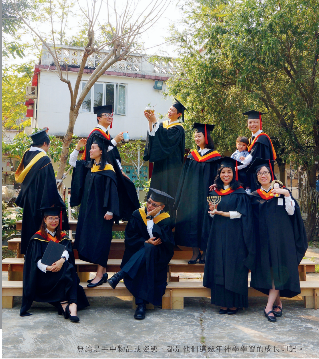
無論是手中物品或姿態，都是他們這幾年神學學習的成長印記。