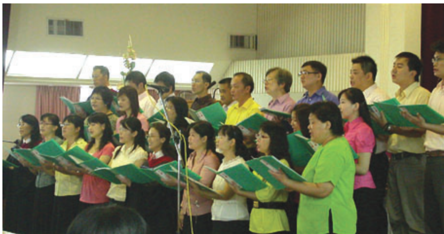
學院詩班獻詩