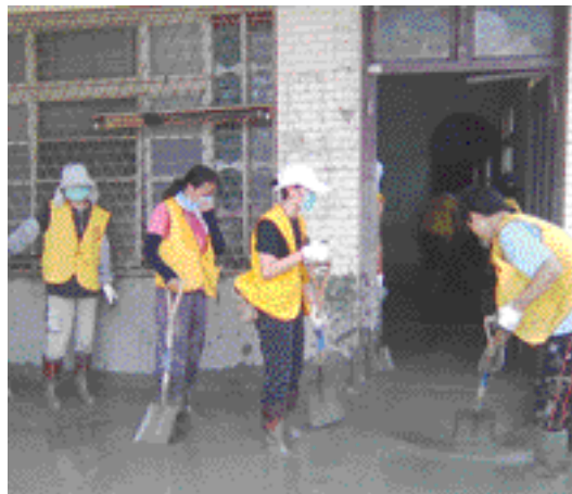
一心聖教會屏東救災行動