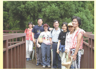
P.8專任教職員一日遊