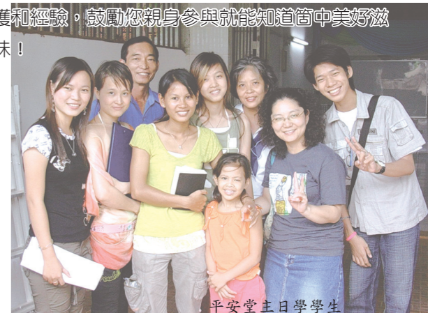
平安堂主日學學生

感謝神讓我參加此次訓練，得到許多寶貴收穫和經驗，鼓勵您親身參與就能知道箇中美好滋味！