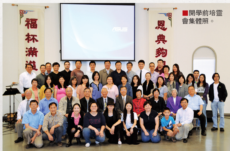
■開學前培靈會集體照。