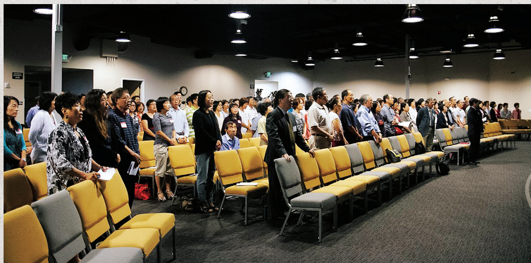
■教育大會參加會眾。

神在家裏的「家」, 是有主的家, 是基督作主的家, 是蒙福的家, 是傳承的家, 是能夠延續上帝救恩的家, 是事奉的家。教會在家裏面, 家在教會裏面。家是裝備訓練兒女成為基督門徒的場所。若是如此, 教會必因此得以茁壯, 成為福音的燈台, 讓這個罪惡的世界, 能夠看到耶穌基督奇妙的救贖。 ■