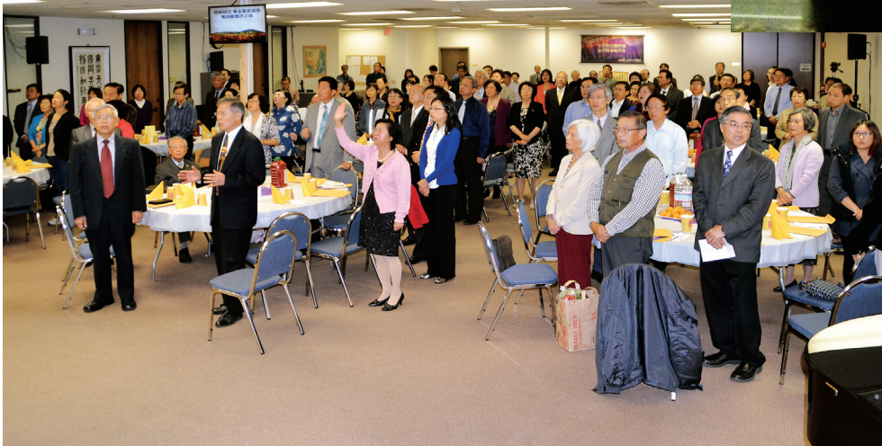
■ 感恩異象分享晚會來賓。