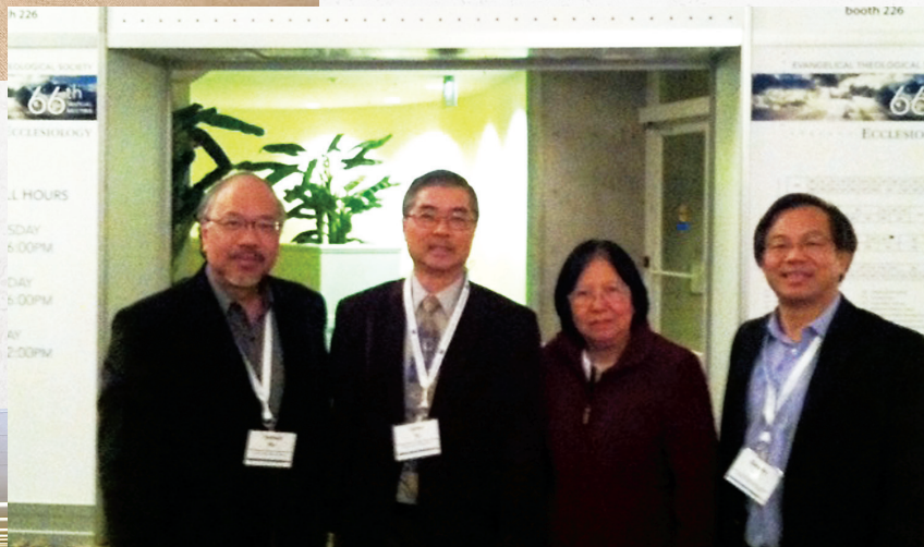
■ 四位老師在聖地牙哥參加學術會議。