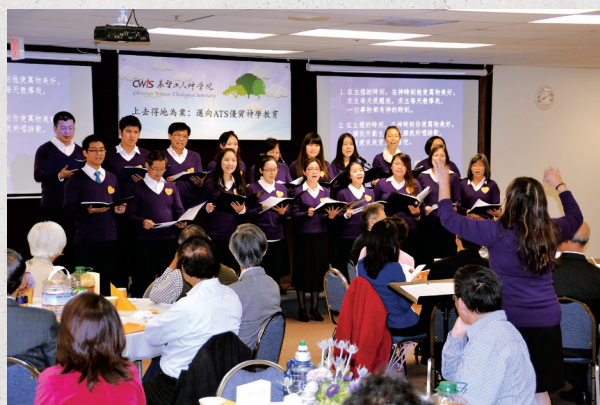
■ 感恩異象分享晚會，學院詩班獻詩。

或者文化背景差異，屬靈經歷差距較大，仍能引起眾人的共鳴，在短時間內，凝聚眾人合一的心。