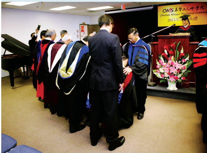
■老師與董事為畢業生按手。