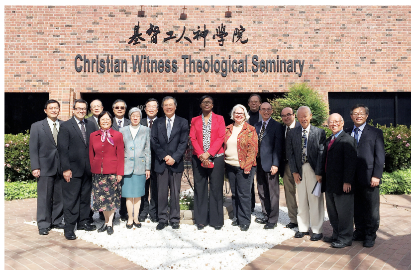
■ATS評審團與老師院董們。

三月三日評審團離開後，有同工對我說：「你可以好好休息了，放假吧！」我衝口而出的回答是：Life goes on! 是的，我還須備課，要做的事委實很多。然而，當天下午，我決定首先數算曾經參與準備迎接及會見評審團的「基神」成員，以便向他們致謝和報告喜訊。結果發現，不包括另一些曾經為此祈禱的人在內，總數已是62人。我為此深深感恩！■