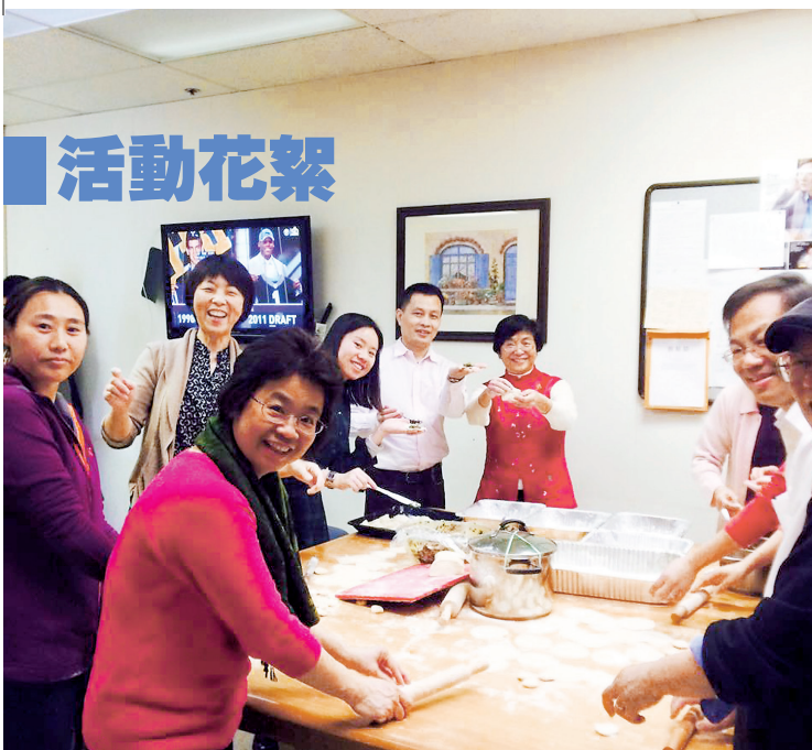
■ 2016農曆新年團契活動。