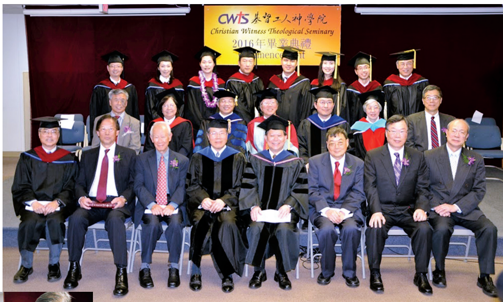
■ 畢業生與主禮團合照。