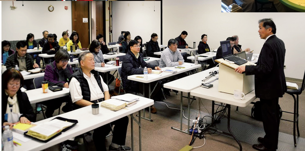
■ 信徒事奉證書『舊約信息精要』課。