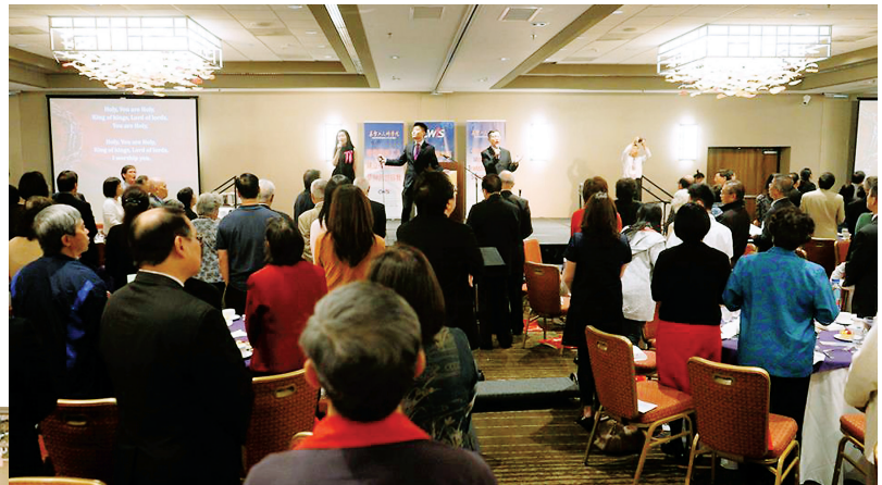
■ 異象分享感恩晚會詩歌敬拜讚美。