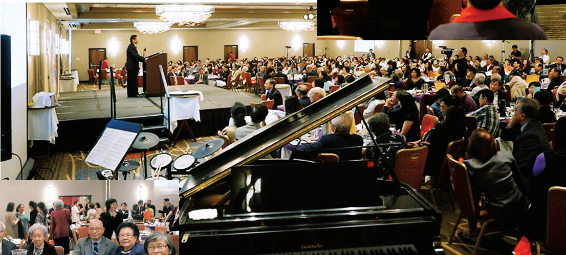
■ 異象分享感恩晚會當晚情況。