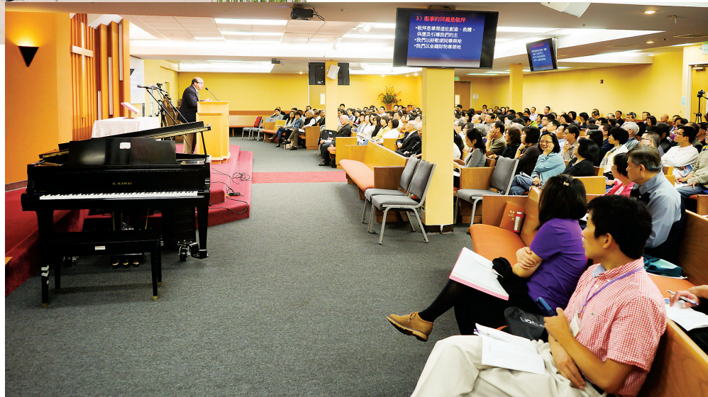
■ 教育大會講員與會眾。