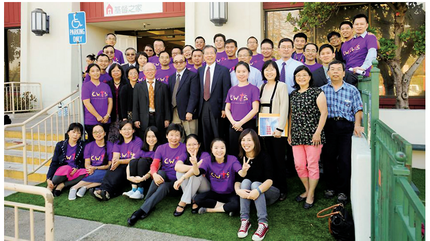
■ 教育大會講員與部分師生同工。