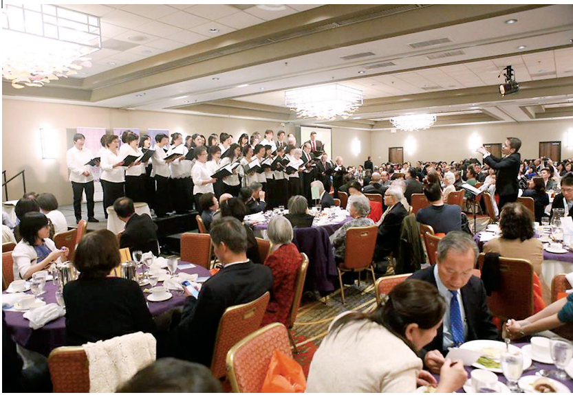
■ 中華基督教崇拜音樂學院詩班獻詩。