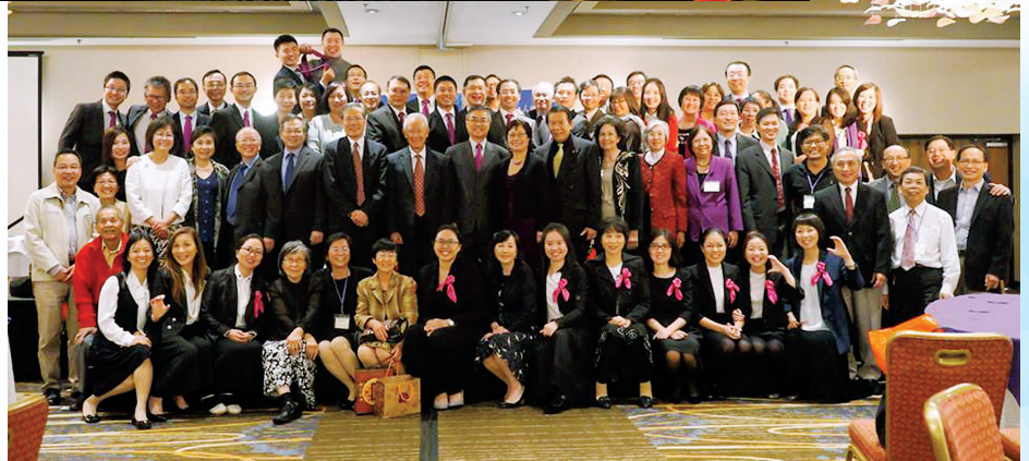
■ 異象分享感恩晚會部分老師同工校友同學合照。