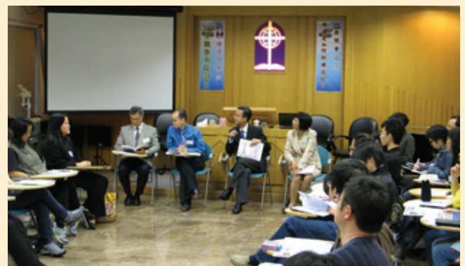
四位老師回應參加者的提問