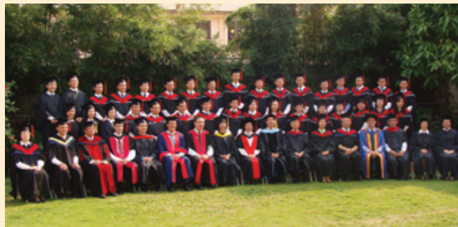
全體畢業生及師長合照

踏入二月，準畢業同學開始陸續在早會宣講信息及在晚禱講述見證。三月二十日(星期五)下午，為拍攝畢業照的日子。是日天晴，師長與準畢業生換上畢業袍，以抖擻的精神加上燦爛的笑容，拍攝畢業照。