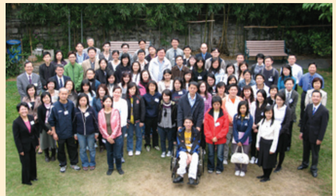
所有參加者與老師在花園留影