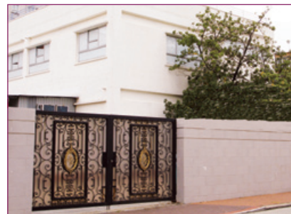
金巴倫道55號外貌及位置圖