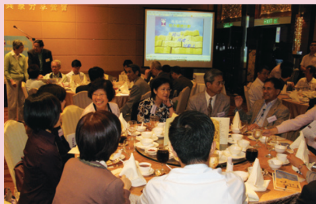
席異象分享會部分來賓