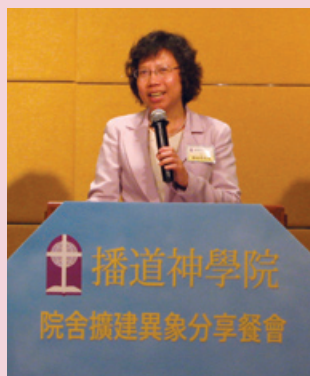
楊院長主講「廿一世紀華人神學教育的挑戰」