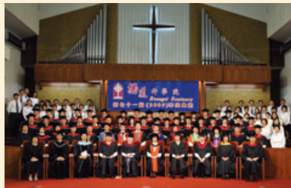
主禮人員、畢業生及日校學生合照