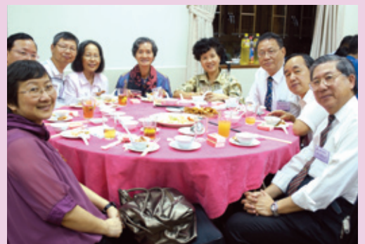
嘉賓與校友於感恩聚餐中暢聚