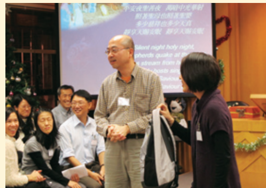
聖誕慶祝會學生領遊遊戲