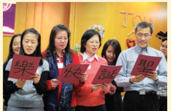
聖誕慶祝會學生唱聖誕歌