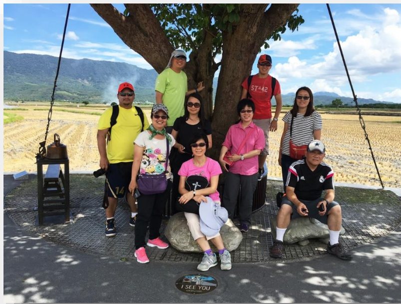
畢業十週年台灣之旅（第二排右一為本文作者）

總結這十年，相信我們仍有很多不足的地方。但另一個十年已經開始了，盼望神帶領幫助我們，在未來事奉路上能夠繼續學習，讓服事的生命更成熟，獻上更美的事奉給那一位愛我們、又呼召我們的神。