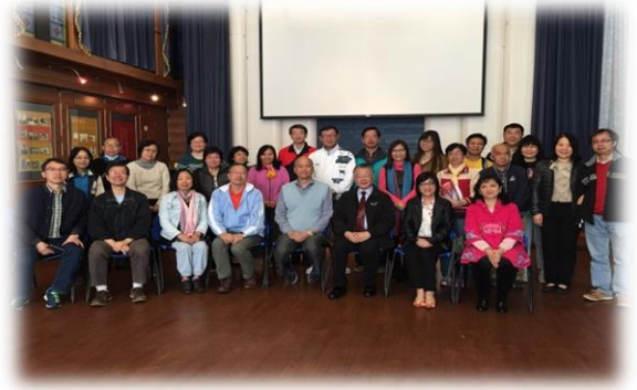
出席專題講座全體校友合照