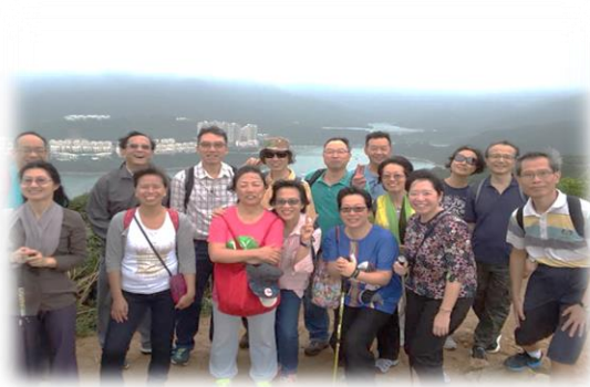
校友們途中合照，背景紅山半島

11月21日 今年校友會舉辦秋季旅行，地點是港島龍脊山徑，路線從石澳道土地灣出發、經過打爛埗頂山和龍脊山，以大潭峽為終點，活動邀請林國彬牧師為領隊。這個位於港島最東南部的山脊，沿途景色壯麗，從山上可俯瞰紅山半島、石澳及大浪灣美景。雖然該日部份路徑較為濕滑，但所有出席校友都能順利完成。