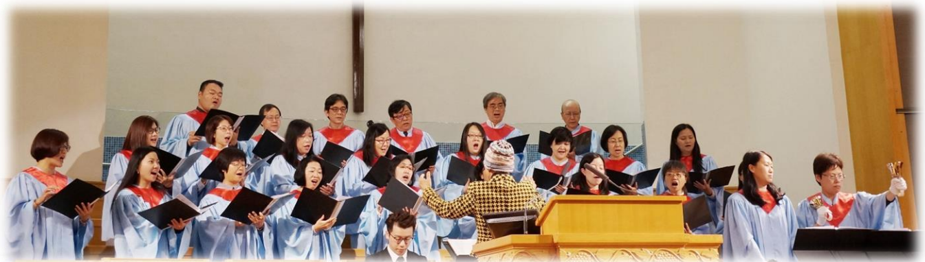
校友詩班於聖誕崇拜中心獻唱