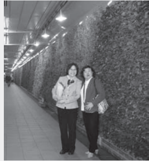
台灣部份捷運站內推行了植生牆樹種計劃，在車站大堂兩旁牆身，種滿了不同品種的植物。

面對台灣的經驗，我們怎樣回應及落實環保工作呢？我們怎樣令下一代或再下一代在一個美好的環境下生活呢？（攝錄）