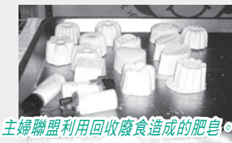
主婦聯盟利用回收廢食造成的肥皂。

「主婦聯盟環境保護基金會」之工作是推動垃圾分類及自備購物袋運動、倡導廚餘堆肥、鼓勵廢食回收做肥皂、辦公室環保工作、成立二手店、推動資源循環型社會等等。基金會工作多為家庭主婦及其家人一同參與，她們的理念是由個人及家庭開始，再推行至學校、社區和教會。