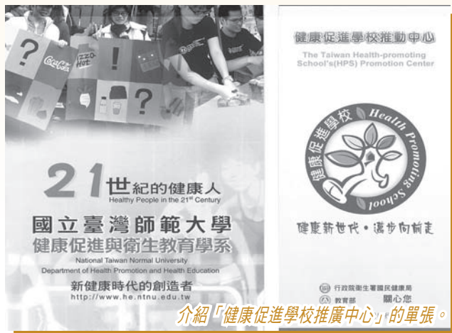
介紹「健康促進學校推廣中心」的單張。

我們在今次的考察中，認識了台灣「健康促進學校推動中心」在推動「健康促進學校計劃」所付出的努力，向他們深表敬意之餘，亦令我們在面對今天教育的林林總總問題有所反思，獲益匪淺。