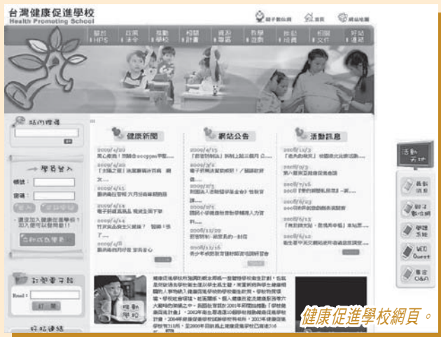
健康促進學校網頁。

品的使用、改變諸如無煙區域的數量、購買香煙的成本和便利程度等對吸煙行為產生影響的環境。因此，內容將有可能針對以下各項：