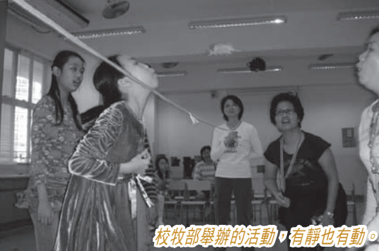
校牧部舉辦的活動，有靜也有動。

第一是以駐校教會為本體： 即教會作主導舉辦各類型活動，透過在學校推動宣傳，鼓勵家長和學生參與，有需要時更會進行