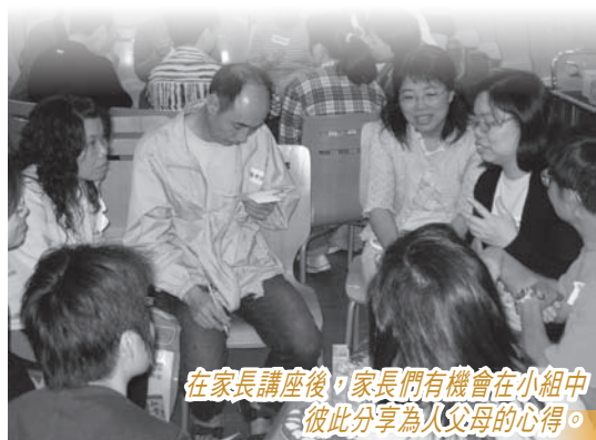
在家長講座後，家長們有機會在小組中彼此分享為人父母的心得。

為校牧部及福音拓展部，財政預算與運作都可獨立而直接向部長堂委跟進，此舉充份表達出教會對校牧事工的重視、承擔及支援。加上去年學校已成立的校牧事工組與堂會配合，可謂裡應外合，相得益彰。