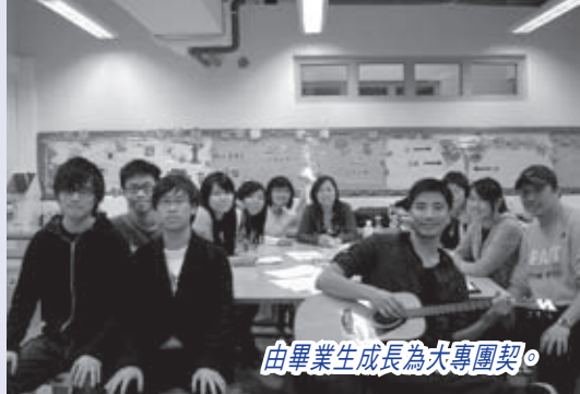
由畢業生成長為大專團契。