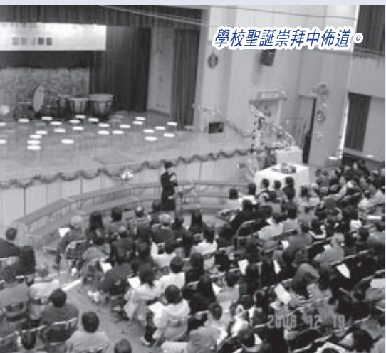
學校聖誕崇拜中佈道。

最近全城都非常關注傷後久休復出的劉翔，他在上海國際田徑黃金大獎賽中以十三秒一五的成績，奪得男子110米跨欄亞軍。其實這成績，離他三年前在瑞士創下的十二秒八八最佳成績，尚有一段距離；而由他所保持的世界記錄，自去年五月他因傷患停賽後，亦已被古巴運動員打破。