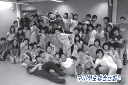
中小學生聯合活動。