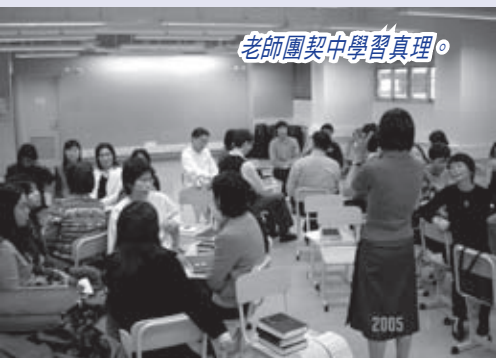
老師團契中學習真理。

感謝主，堂與校現在有很美好的搭配，學校對教會也很有信心；為此教會要更加努力，因為我們做事不是為討人歡喜，乃是要討上帝歡喜，並且得上帝的獎賞。最後，祝願基愛堂繼續在基灣小學（愛蝶灣）中見證基督的大愛，持守實踐那份「不問收穫的服事」。