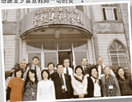
全體攝於聖經專科學校外。

深盼以上一些所見聞的不足之處，是值得國內教會的管理階層(特別是江、浙教會)去思想的問題。