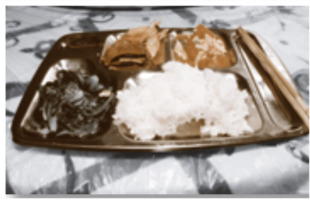
聖經專科學校的午餐。

青菜），只是我們的盤子上加添了兩個特為我們而設的小菜：白灼蝦和牛肉。雖然整個行程我們的膳食非常豐富，菜式上這是最普通的，