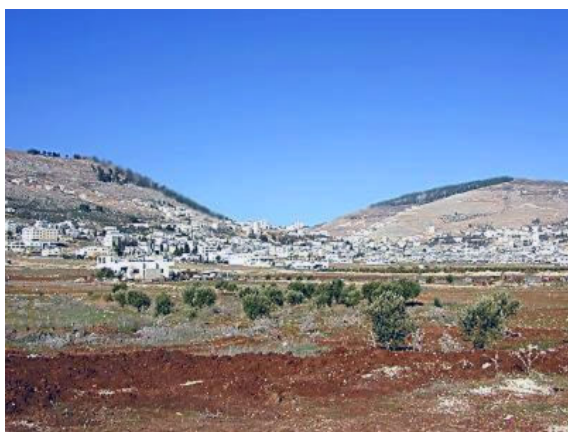
面地中海的话—基利心山(左)以巴路山(右) 但若面东，右边则是基利心山