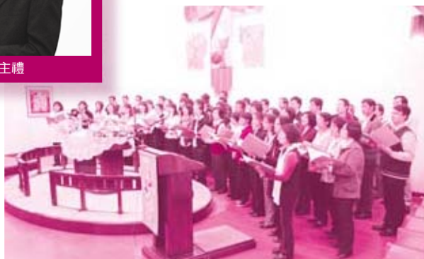
信義宗神學院詩班獻唱