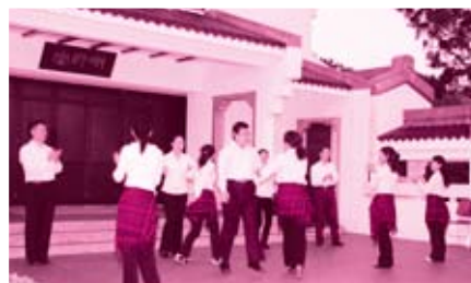
中國同學舞蹈表演