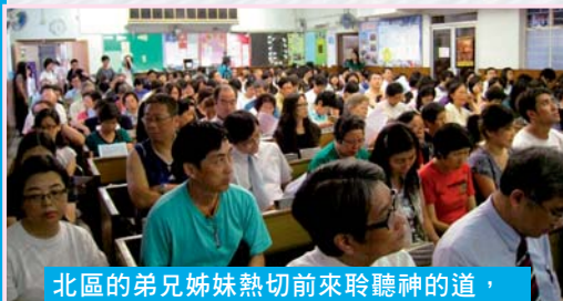
北區的弟兄姊妹熱切前來聆聽神的道，不單坐滿了禮堂，連副堂也坐滿了。

從5月到7月，本社一連舉辦了四次聖經講座，包括兩次專題講座及兩次特別講座，幫助信徒研讀雅各書、馬太福音、以賽亞書和詩篇，讓弟兄姊妹藉著神的話語反省他們的人生。四次講座總計有一千二百人次赴會，看著他們從遠處的家裡，或從辦公室匆匆趕到，實在為他們感謝神。願天父使他們的心靈飽足。今期摘錄四次講座的內容精髓，與弟兄姊妹分享共勉。