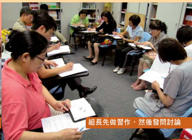
組長先做習作，然後發問討論