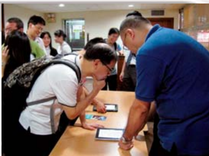
這位弟兄對於明道社的iApps興趣甚濃