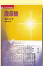
啟示錄——萬主之主（研經本） 孫寶玲著