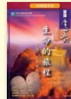
「3D研經系列」《認識摩西五經——生命的旅程》 區應毓等著