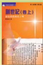
創世記（卷上）——創造與拯救的上帝（研經本） 鄭炳釗著