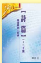
詩篇（一～二十篇）——稱頌顧念人的神（研經本） 鄭炳釗著