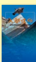
人間信仰——從約拿書看信徒如何在現實中活出信仰 梁家麟著