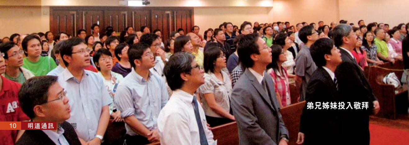
弟兄姊妹投入敬拜