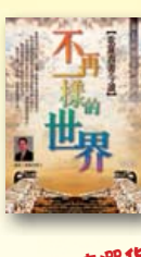
《不再一樣的世界——歌羅西書今讀》第七屆明道聖經講座MP3 鮑維均主講