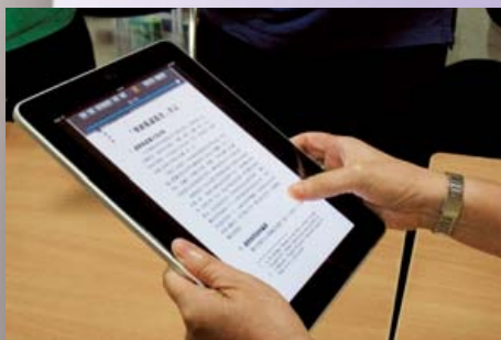
參加者親身體驗閱讀下載到iPad的明道研經書，真箇樂在其中