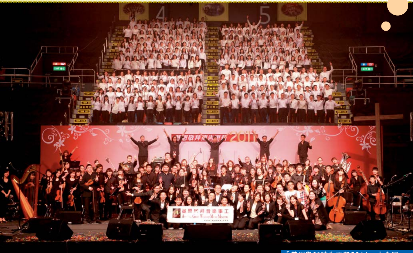
「基恩敬拜禱告更新2011」大合照