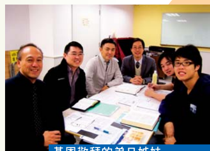
基恩敬拜的弟兄姊妹 參加本社聖經精讀團契後 與講員合照

答：我們的異象始終如一，藉詩歌讚美和見證神，希望神使用我們成為流通的管子，讓人更多經歷神。未來的發展我們交在神的手中，不斷禱告，以榮耀神和見證神為目標，相信聖靈必定帶領我們。