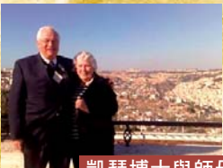
凱瑟博士與師母 在耶路撒冷合照

華德凱瑟這個名字，華人信徒大概不感到陌生，從上世紀八十年代的《舊約今讀》《舊約神學探討》《解經神學探討》《舊約倫理學探討》等中譯著作，到本世紀的《舊約續篇》《古道今釋：如何宣講和教導舊約信息》等書籍，凱瑟博士多年來給予華人信徒不少釋經和神學上的啟迪，開拓我們舊約研究的眼界。