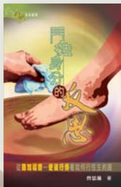
曾博士新作 《門徒身分 的反思：從

路加福音和使徒行傳皆為路加所寫，但我們在研讀或查考時，卻甚少把兩卷書扯上關係，我們習慣抽取某些片段獨立研究，忽略了經文的整體脈絡。在是次講座中，曾博士帶領弟兄姊妹以「一個故事」的角度來研讀路加福音和使徒行傳，透過闡釋兩卷書中有關聖靈故事的平行記載，他清楚展現路加寫作兩書所要傳達的信息：基督徒的天路歷程是個冒險，必須突破種族、仇恨、偏見，才能承擔福音廣傳的使命；教會在地球上傳承耶穌基督的工作，亦須接納和關心社會上遭遺棄的邊緣人，活出基督，活出敘事的一部分。對是次講座內容有興趣的讀者，可以日後留意明道社網站的專題講座影片上載。