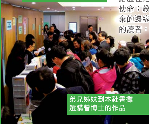
弟兄姊妹到本社書攤 選購曾博士的作品