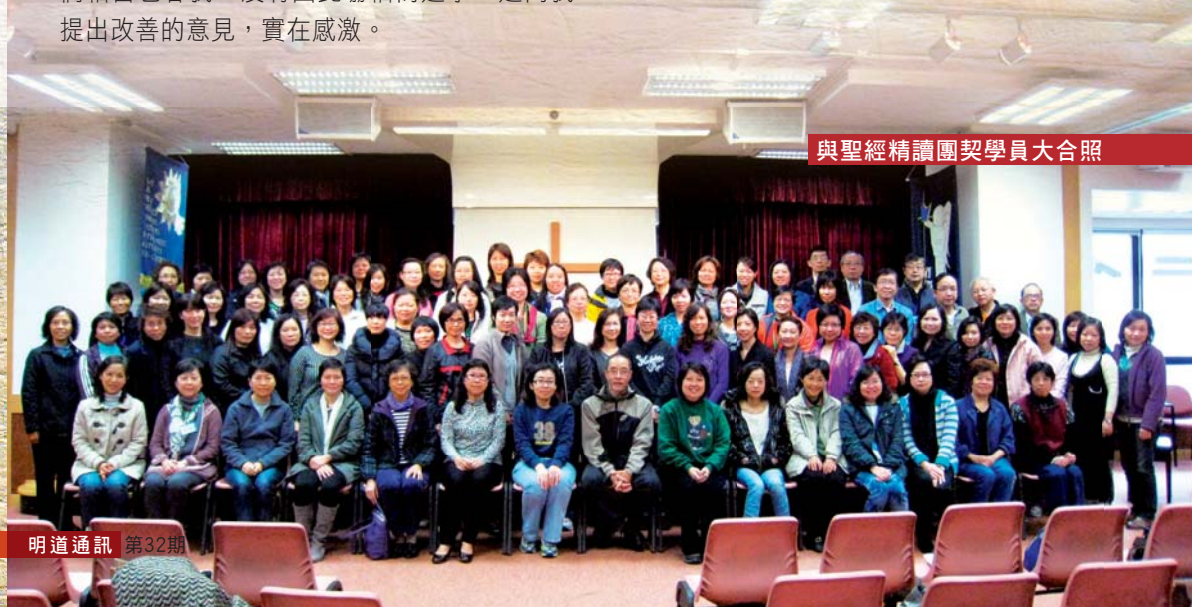
與聖經精讀團契學員大合照

明道社發展至今，實在見證著神的恩典和弟兄姊妹的支持。我想請你們在各方面繼續支持我們：金錢奉獻、作義工、鼓勵你們的弟兄姊妹參加聖經精讀團契等。最重要的是為我們禱告，求主額外施恩，帶領我們忠心在神的話語上的事奉；也願彼此代禱，求天使使我們天天愛慕祂的話，明白而遵行。