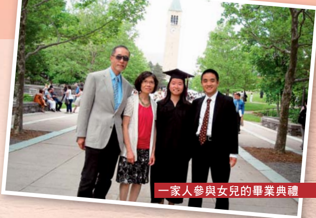
一家人參與女兒的畢業典禮

有些學員與我熟落後，知道我一人在港生活（我太太暫時仍留美），就十分照顧我，偶爾給我送上小禮物和問候卡，又會邀請我一起飯聚，尤其是過年過節的時候，免得我獨自一人孤獨思家。我母會北角福音堂的弟兄姊妹更每週給予愛心飯餸和湯，直是我的家人。感謝神為我預備了弟兄姊妹，使我縱然一人在港也不孤單，他們的關心，讓我感到溫暖。再者，由於我的中文水平不大好，有時表達得不夠清晰，令學員要多花時間和心力預備習作，但他們相當包容我，沒有因此嚇怕而退學，還向我提出改善的意見，實在感激。