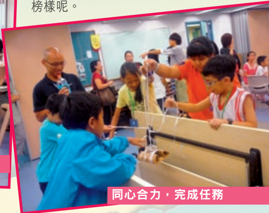
同心合力，完成任務