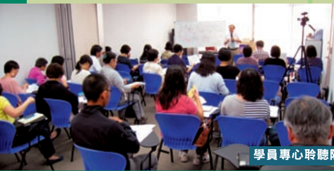
學員專心聆聽陳錦友博士教導

首次開辦的「舊約經卷研讀班」已於7月31日開課，早上和晚間合共超過一百位弟兄姊妹報讀。除本社同工外，還特別邀請了多位聖經學者親臨教授，包括陳錦友博士、黃儀章博士、李雋博士和蒙日昇牧師。平日艱澀難明的書卷，透過他們的講解，學員都能明白當中寶貴的信息。深願這課程能幫助弟兄姊妹更明白、更渴慕神的話語。