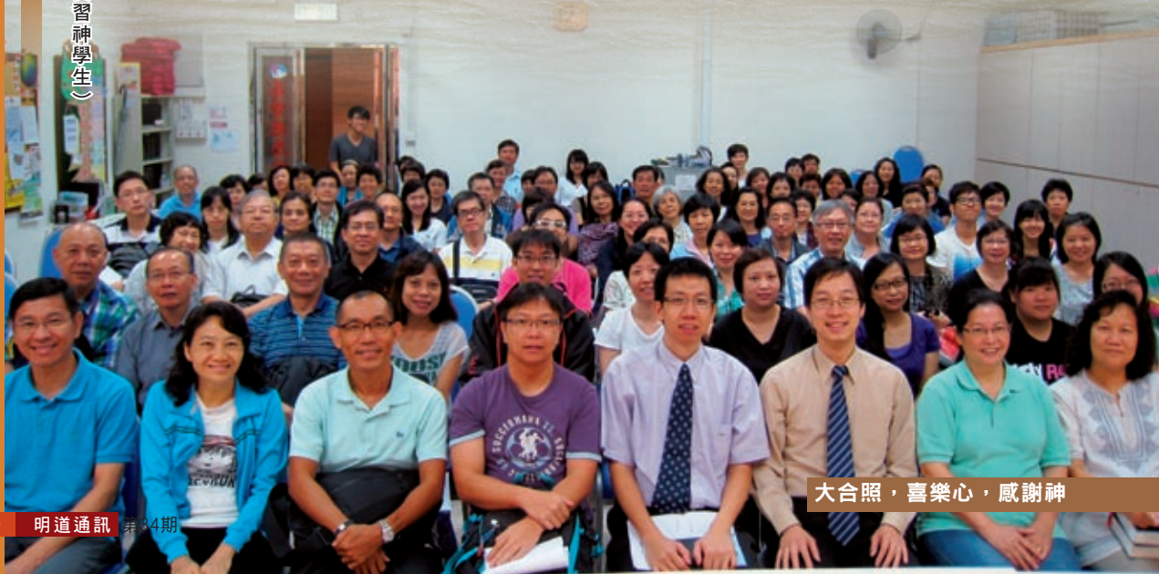
大合照，喜樂心，感謝神