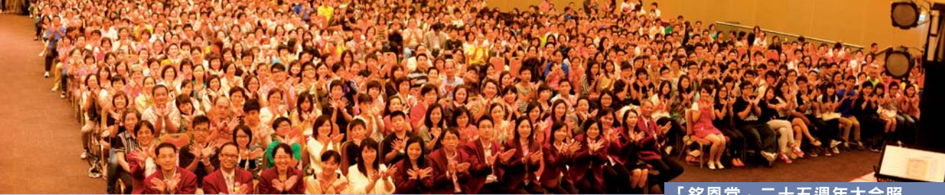
「銘恩堂」二十五週年大合照

問： 「銘恩堂」已有一定人手和資源開辦主日學和聖經課程，為甚麼還有意跟其他機構合作？