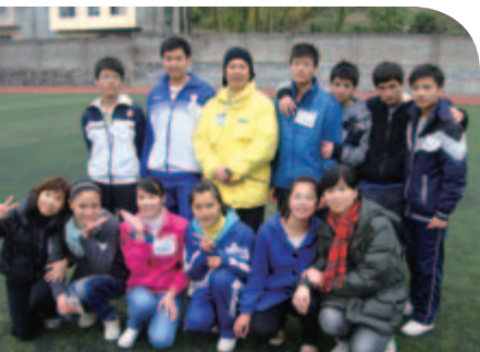
參與教會廣西探訪活動， 與學生合照（前排左一）