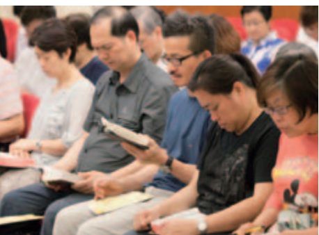
弟兄姊妹熱衷學習聖經

旺浸現有一個完整的三年計劃，主題是「作個服侍社群的敬虔人」。我們特別希望可以走進社區，接觸關懷新移民，向他們傳福音。服侍基層貧窮人有很多學問，也需要很多技巧。在研讀聖經的過程中，我們要思想該以甚麼態度來與他們相處，同時又要仔細觀察他們的背景，學習用淺白的言語來跟他們深入溝通。這是一個「內進歷程」，有一定難度，所以我們要花三年時間來學習。我們以耶穌基督的服侍為榜樣，學習祂走進人們中間，自然流露出有生命力的信仰，而不是曲高和寡的信仰。