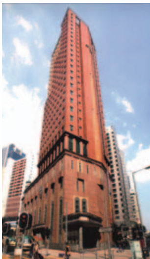
「循道衛理聯合教會香港堂」外貌

按我的觀察，參加培訓課程的弟兄姊妹除了希望能多了解聖經，還希望在日常生活裡實踐聖經的教導。這是我非常高興和欣賞的。