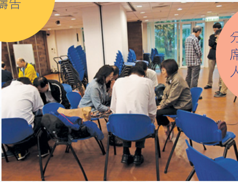
分享美味的筵席·也分享各人的生活