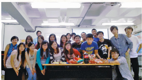
一同在教會長大的弟兄姊妹 (右下)