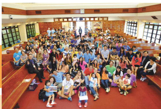
2013年九龍塘宣道會開放日聚會

此外，精讀團契亦是個很好的機會，讓弟兄姊妹體驗肢體相交的生活。團契每月都有分組聚會，各組員彼此分享，互相扶持，那份相交令弟兄姊妹十分難忘。當大家知道有組員正經歷人生困境、家庭幻變、疾病困擾……時，整個小組就會一起禱告支援，而導師亦充分擔當關顧和牧養的