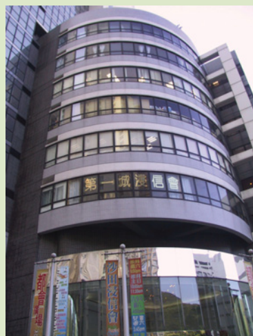
位於沙田都會廣場的第一城浸信會

明道社推動信徒學習聖經，確是盡心竭力，除精讀團契和讀經課程外，有時還舉辦聖經專題講座，而最吸引我的就是這幾年開辦的暑期聖經研讀班。每一次研讀班都集中研究新約或舊約，並邀請多位學有專精的聖經學者任教，單看傳單已令人心動，能親身上課必定獲益良多。願明道社繼續與教會合作，在教導聖經真理、提升信徒讀經興趣上一同努力！🔥