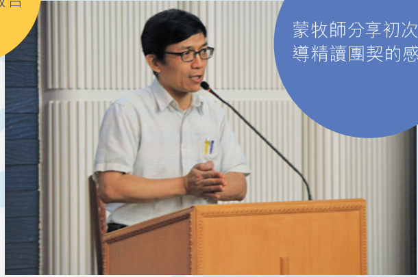
蒙牧師分享初次教導精讀團契的感受