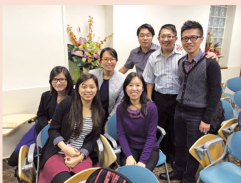
與播道神學院學生合照

答： 感謝神使用這本書！我也收到一些姊妹的反應和意見，我很高興這本書能夠對她們有幫