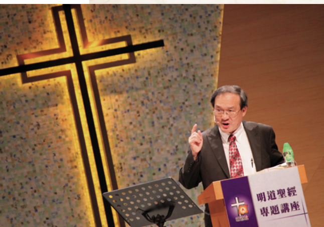
陳牧師嚴肅而著緊地解經