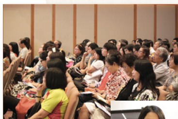
聚精會神聆聽神的話