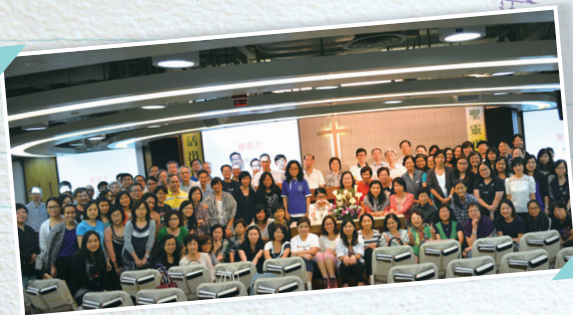
與北宣晚學員大合照